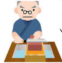
刃物・工具等の修理