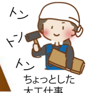
ちよつとした 大工仕事