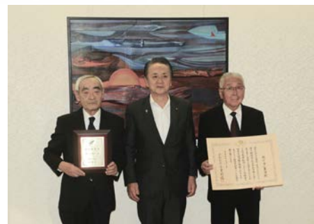
＜社会参加章＞受章・横須賀市庁舎にて