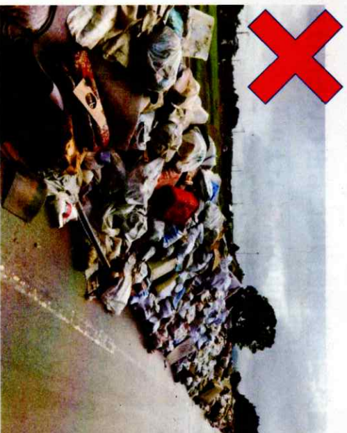
『令和2年7月豪雨 熊本県人吉市』