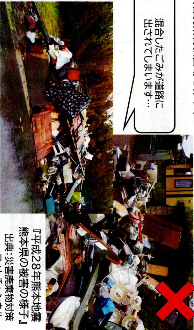
『令和元年房総半島台風 千葉県鋸南町』