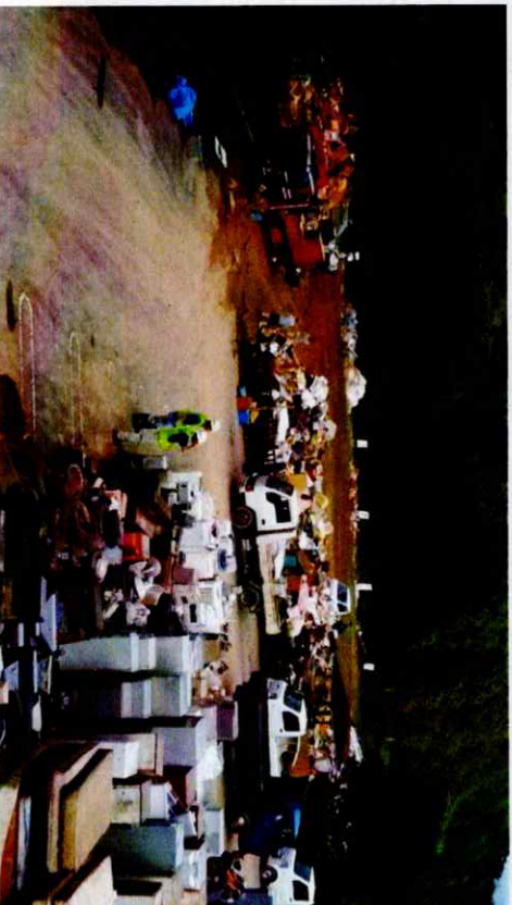
『平成29年九州北部豪雨災害 福岡県朝倉市』