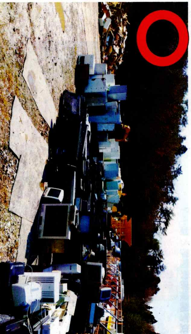
『令和4年福島県沖を震源とする地震 福島県相馬市』