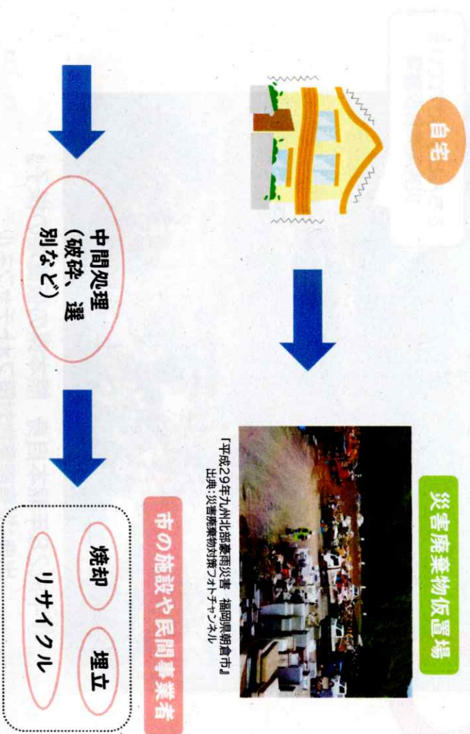
『平成29年九州北部豪雨災害 福岡県朝倉市』