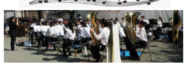
★野比中学校 吹奏楽部 演奏