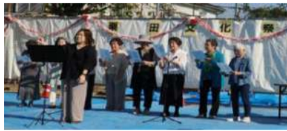
★楽しく歌う会 輝き