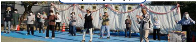
★粟田フリフリ体操クラブ