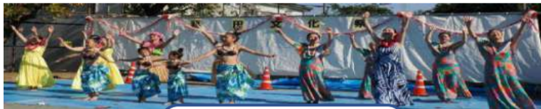
★マハナ・フラサークル