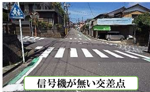
信号機が無い交差点