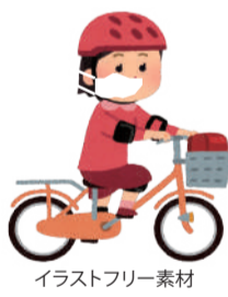
イラストフリー素材