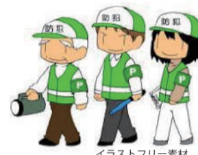
イラストフリー素材

・ちかん等の被害にあった際は、すぐに逃げて店員さんや近くの人に助けを求めましょう。