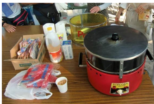
熱くなったら油を注入 (目分量)