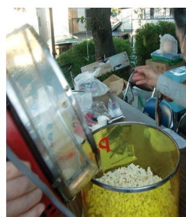
受けボールで食塩3掴みを入れ、 掻きまわす