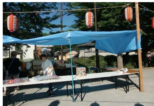
ブルーシート張り