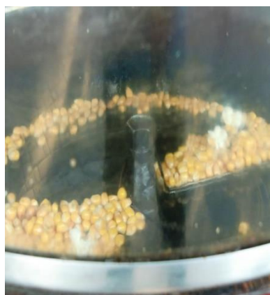
コーンの素を1袋分入れる (入れすぎると膨らみ不足)